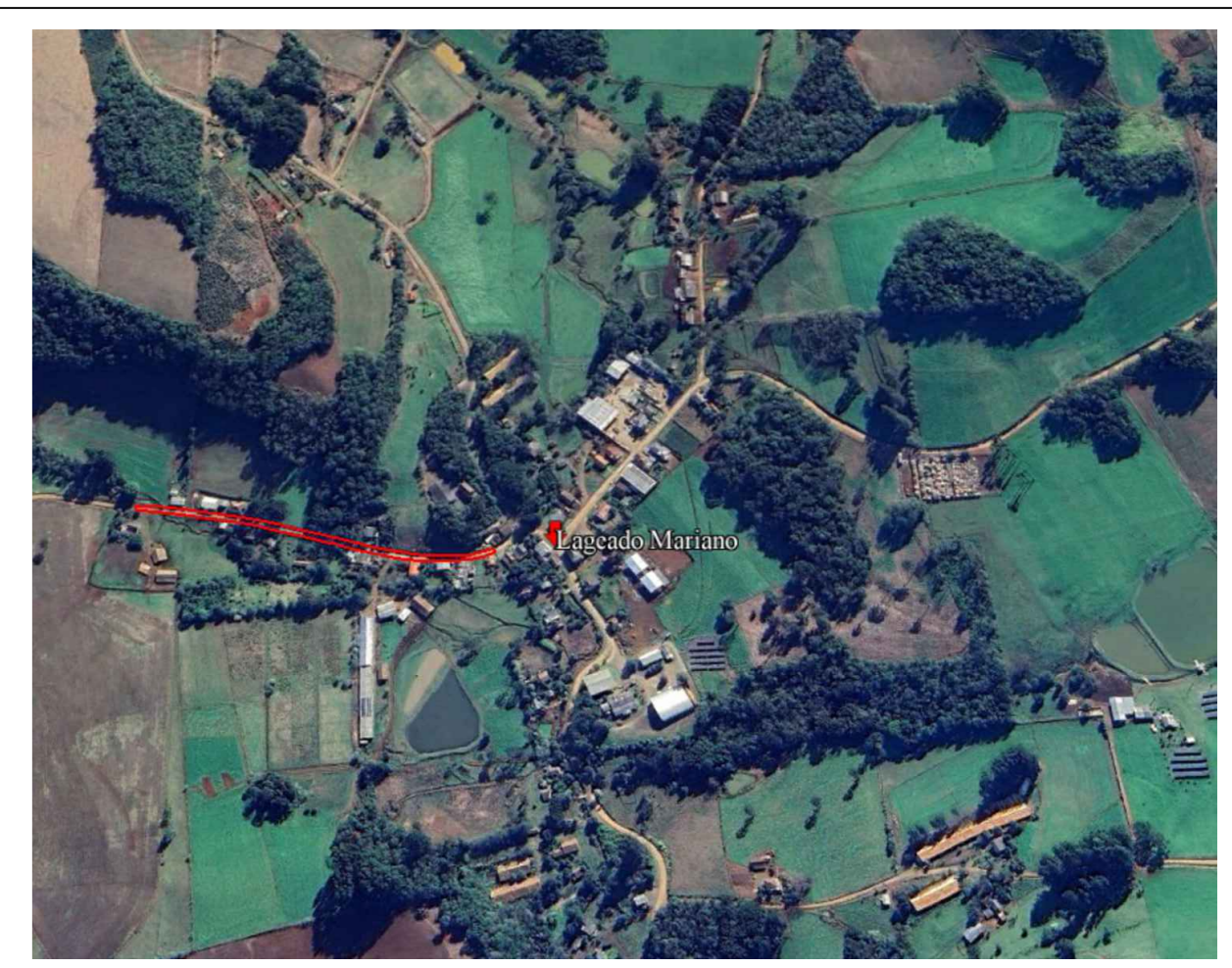
PLANTA DE LOCALIZAÇÃO ESCALA: RELATIVA