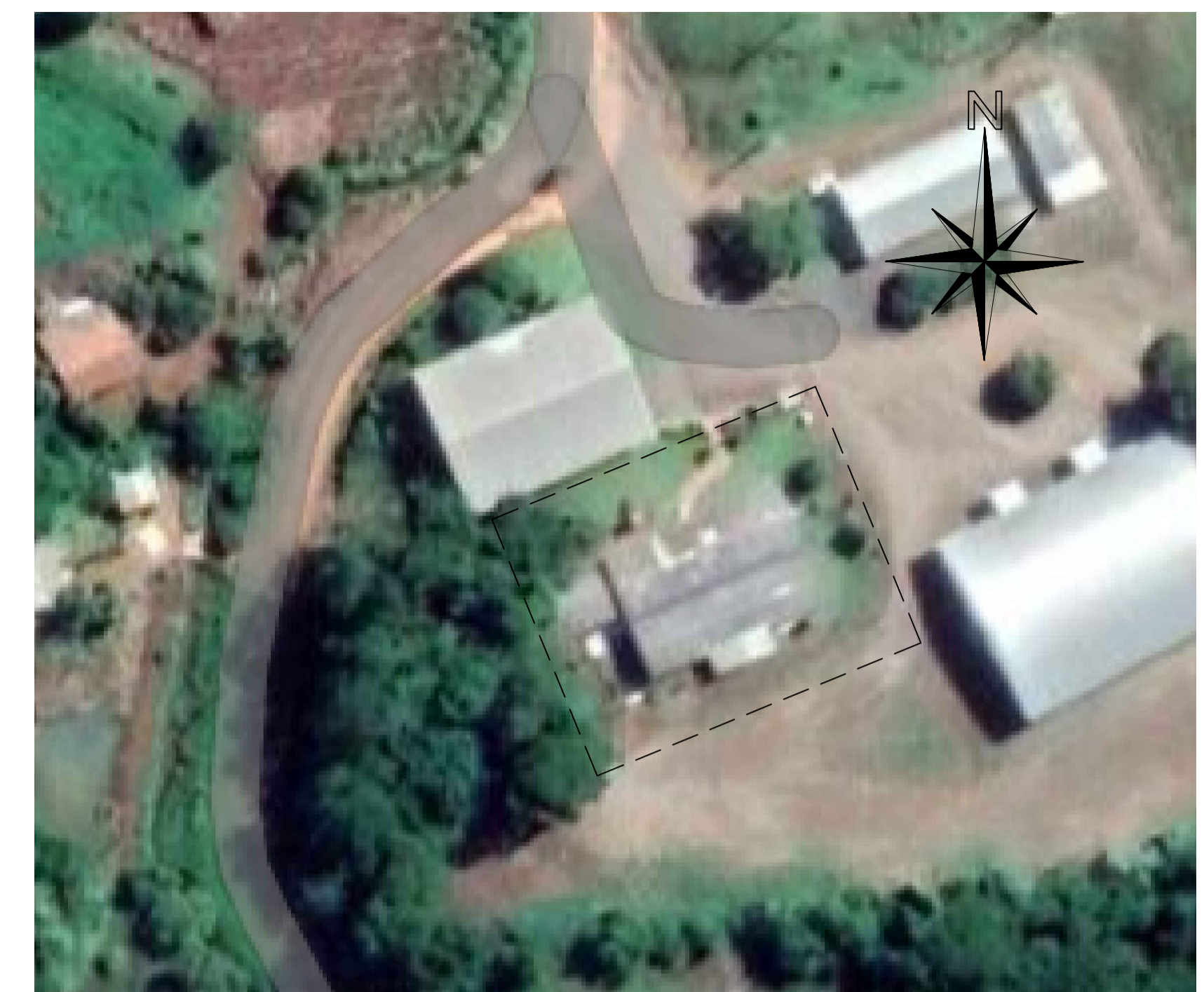
Situação - Escola Rodolfo Holeveger _____ Sem escala