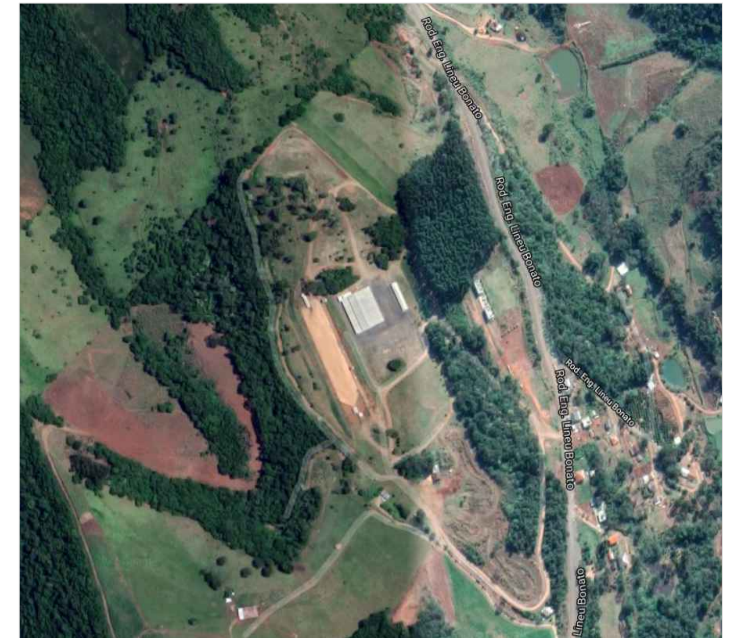
Situação _____ Sem escala