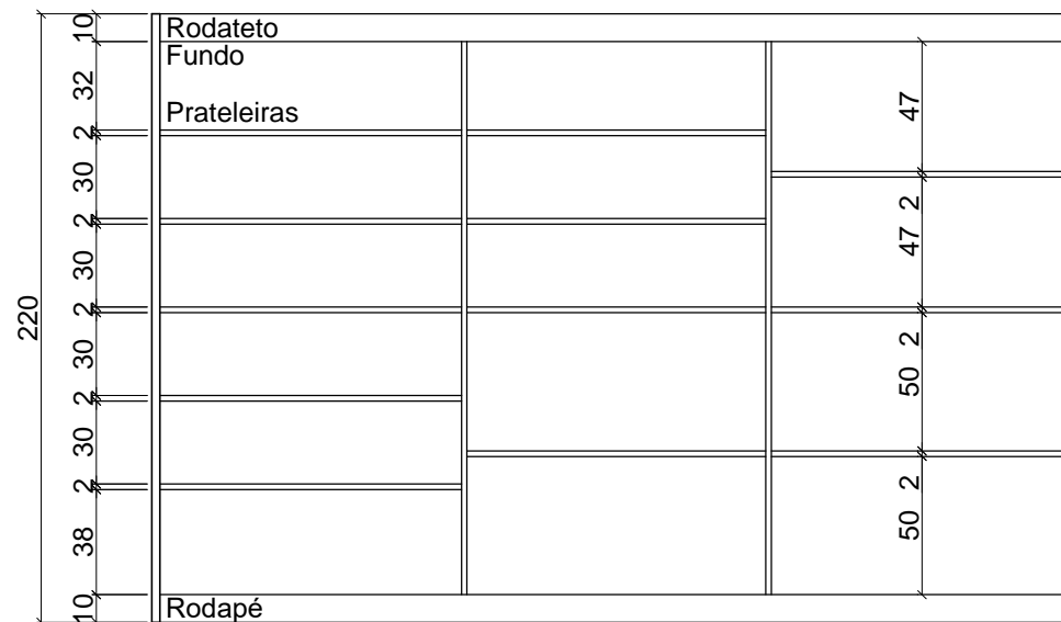
VISTA FRONTAL INTERNA - ARMÁRIO 02