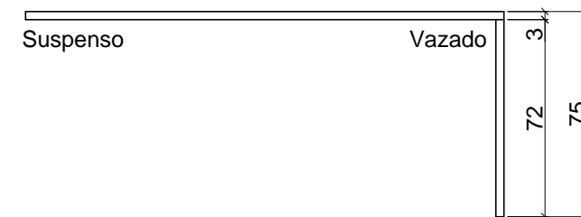
VISTA FRONTAL - MESA ESC. 1:25

OBS: MEDIDAS EM CENTÍMETROS. TODAS AS MEDIDAS DEVERÃO SER CONFERIDAS NO LOCAL