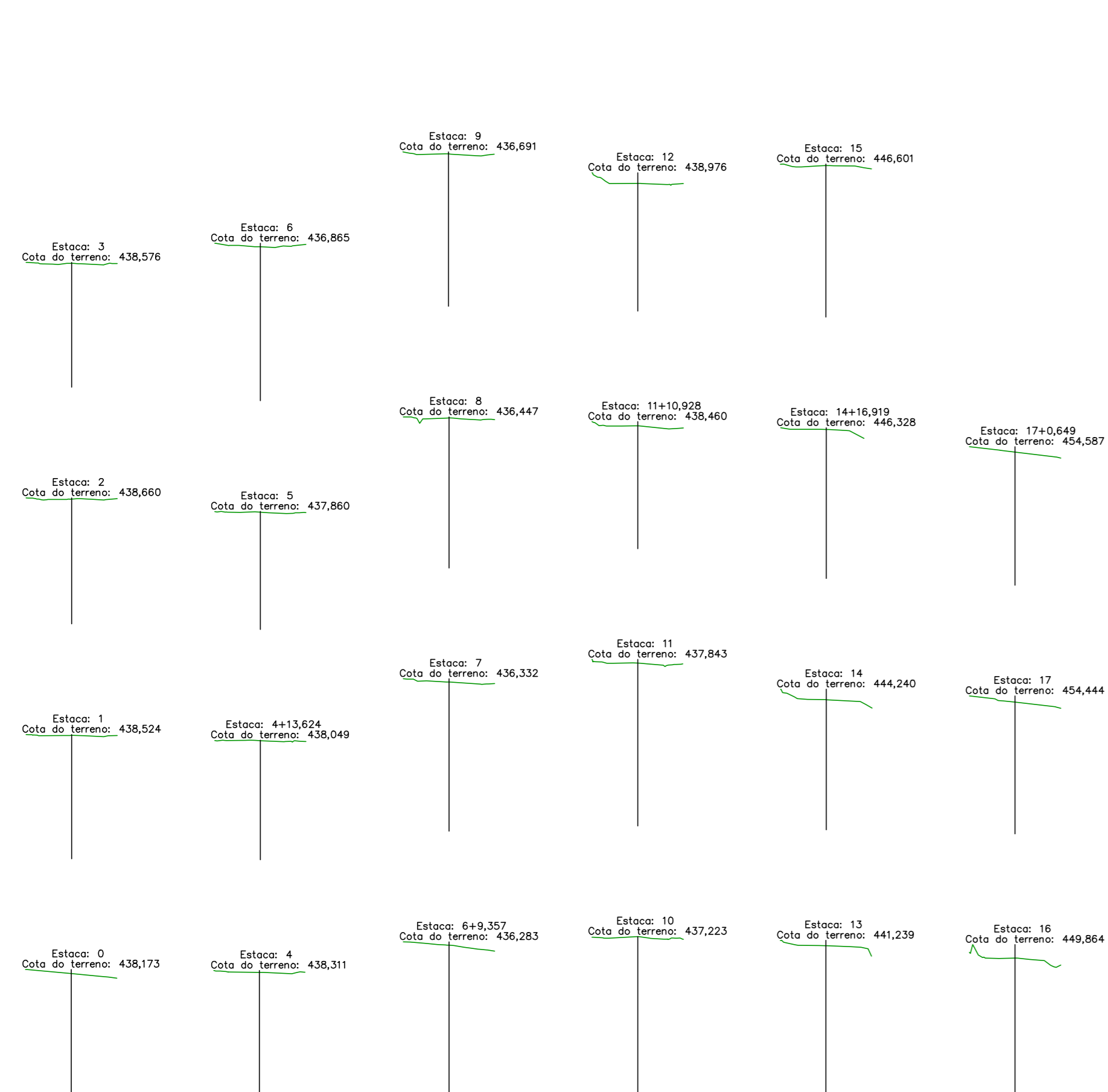
SEÇÕES DA RUA ACRE ESCALA 1/500